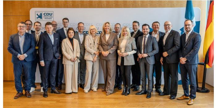
Unsere Fraktion steht mit Vertretern der Luftverkehrswirtschaft in einem ständigen Austausch.

Der Flughafen Frankfurt ist ein zentraler Wachstumsmotor für Hessen und Deutschland. Über 100.000 Arbeitsplätze sind direkt oder indirekt mit ihm verbunden. Das neue Terminal stärkt diese Rolle nachhaltig und sorgt für