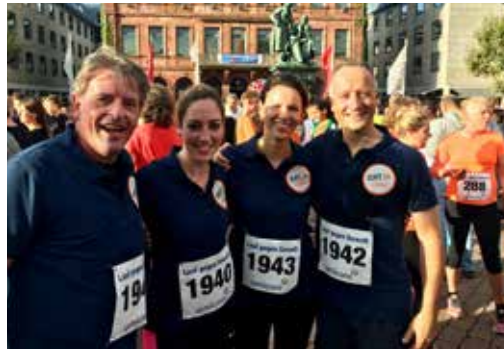
Die Mannschaft der CDU

Auch beim diesjährigen Hanauer Stadtlauf gegen Gewalt an Frauen haben wir als Team der CDU teilgenommen. Mehr als 2.000 Teilnehmer haben so ein Zeichen gesetzt, wie wir in unserer Gesellschaft die Gleichberechtigung von Mann und Frau sowie das Miteinander verstehen. Daran darf es keinen Zweifel geben.